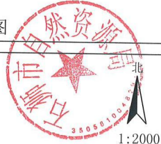
石狮市第七实验小学第二校区勘测定界图